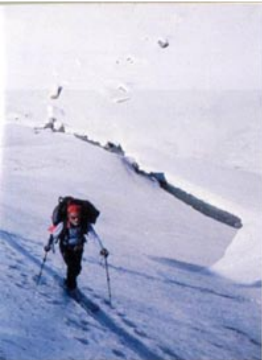
Qui a destra in discesa dall'Aab-Saeftid

mente perché colpisce tutti noi con il suo splendido profilo. Solo in un secondo tempo, già sulla via del ritorno, scopriremo che il suo nome vuole dire 'Sette Uomini'. Sarà anche un caso, ma niente ci toglierà dalla testa che quei sette uomini eravamo proprio noi.