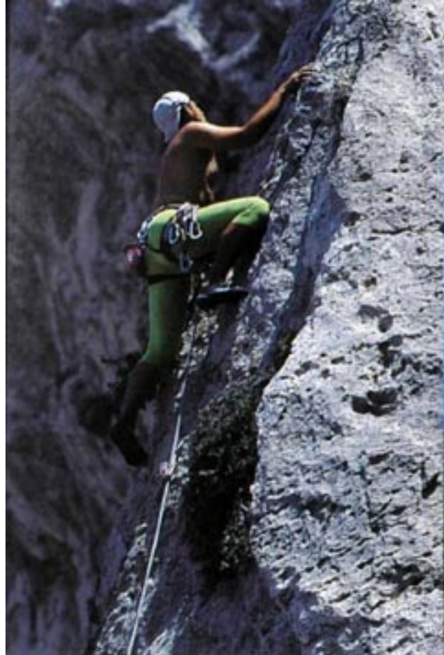
Qui accanto: a Odissey, su placche a gocce e a buchetti, incastrate fra grandi pareti strapiombanti. Sotto: una vecchia campana, legata all'ulivo cresciuto a ridosso del monastero di Agios Kostantini, è il simbolo della devozione popolare.